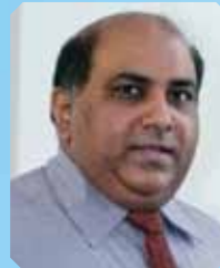
莫哈默德·阿布拉罕 教授 (马来西亚) 亚太抗癌联盟前任主席、马来西亚肿瘤协会主席