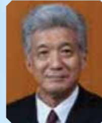
田岛何雄 教授 (日本) 日本三重大学