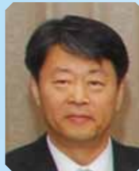
李昌勋 教授 (韩国) 韩国放射医学研究所