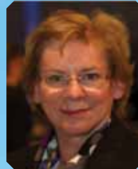
玛丽·高兹旁德维兹 教授 (加拿大) 国际抗癌联盟主席、加拿大多伦多大学马格瑞特皇后医院