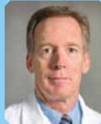
阿兰·李斯特 教授 (美国) 莫菲特肿瘤中心院长