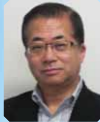
赤座英之 教授 (日本) 亚太抗癌联盟副秘书长、日本东京大学