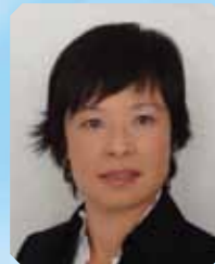
贾丽 教授 (英国) 英国伦敦大学