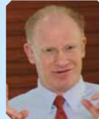
约翰·艾德勒 教授 (美国) 美国斯坦福大学医学中心