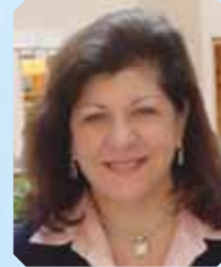
玛格丽特·弗缇 教授 (美国) 美国癌症研究协会首席执行官