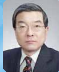
卢宰京 教授 (韩国) 亚太抗癌联盟秘书长、韩国延世大学肿瘤中心