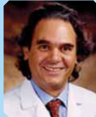
卡罗·克洛斯 教授 (美国) 美国科学院院士、美国俄亥俄州立大学