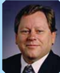
威布斯特·卡万尼 教授 (美国) 路德维格癌症研究所圣地亚哥分部主任