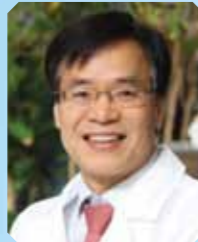
李钟胤 教授 (韩国) 韩国放射医学研究所